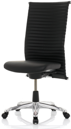
HÅG H09 Meeting 9372 killoitetulla alumiinijakaristikolla (lisävaruste)