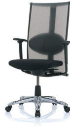
HÅG H09 Meeting 9272 killoitetulla alumiinijakaristikolla (lisävaruste) and armrests (optional)