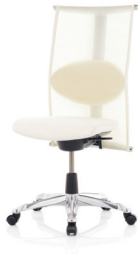
HÅG H09 Meeting 9272 kapealla killoitetulla alumiinijakaristikolla (lisävaruste)