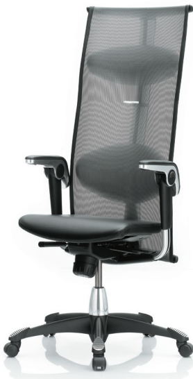
HÅG H09 Inspiration 9230