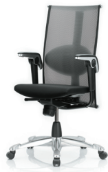
HÅG H09 Inspiration 9220 kiltotetulla alumiiniristikolla (lisävaruste)