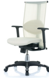
HÅG H09 Inspiration 9220