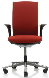
HÅG Futu 1020 (lisävarusteena käsinojat)