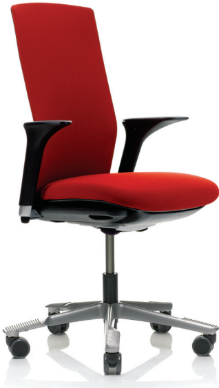
HÅG Futu 1020 (lisävarusteena käsinojat)