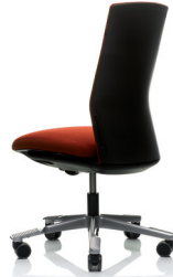
HÅG Futu 1020